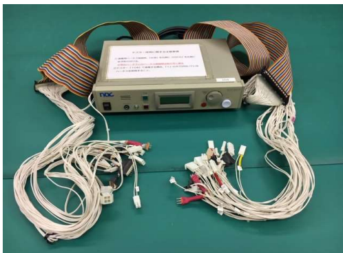
通電テスター (全数引張試験と導通チェックを実施)