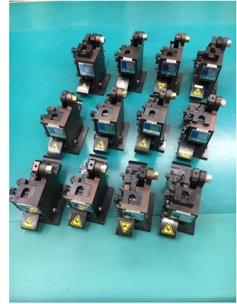
各種アプリーケーター (JST,JAM他多数取り揃えております)