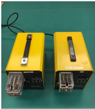
ワイヤーストリッパー (UL線など細い線の被覆剥き機)