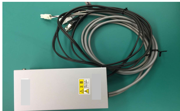
特注制御ボックス