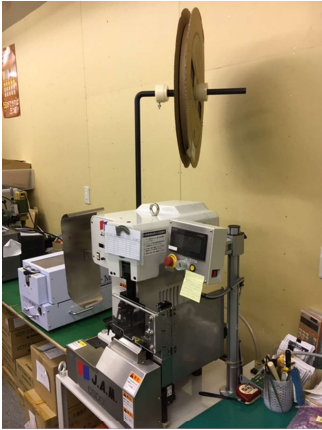
半自動圧着機 (設定だけで誰でも圧着可能)