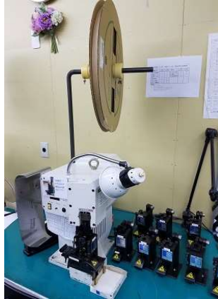
半自動圧着機 (熟練の作業員がスピーディに)